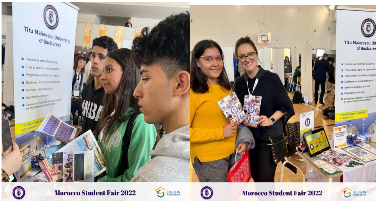
Morocco Student Fair 2022