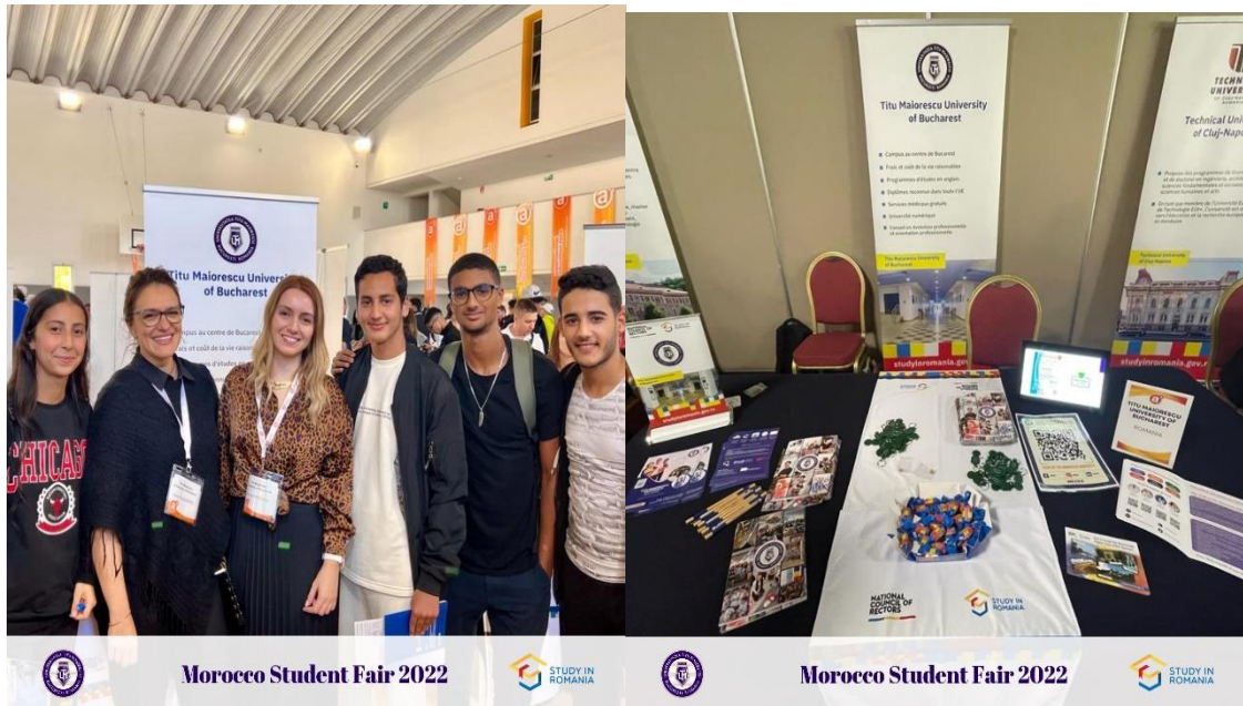
Morocco Student Fair 2022